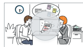
La directive MIF2 en vidéo

→ renforcer et développer de manière plus systématique sur ce type de clientèle, la diversification des actifs souscrits au sein des enveloppes de placement telles que PEA, PEA-PME, assurance-vie, compte titres.