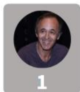
1 Jean-Jacques Goldman 33%