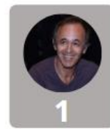
1 Jean Jacques Goldman 39%