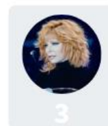
3 Mylène Farmer 12%