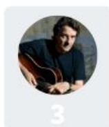
3 Francis Cabrel 21%