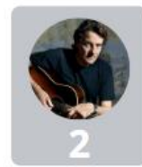
2 Francis Cabrel 28%