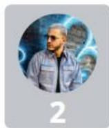
2 Dj Snake 34%