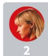
2 Angèle 14%