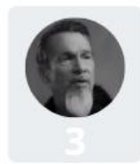
3 Florent Pagny 27%