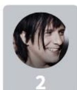
2 Indochine 23%