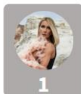
1 Céline Dion 17%