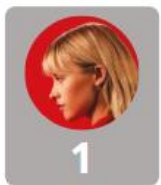
1 Angèle 35%