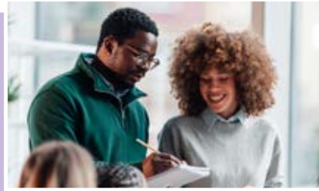
Actualités fournies par Associatheque.fr , en partenariat avec Juris associations .