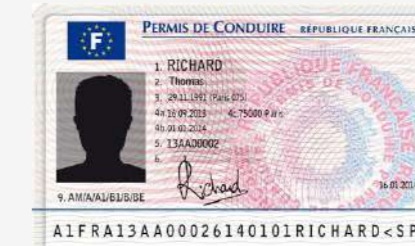
Permis de conduire français