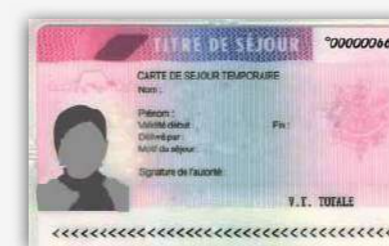
Titre de séjour