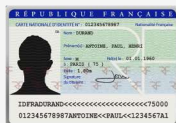
Carte nationale d'identité