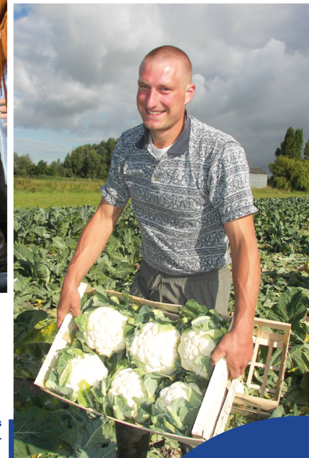
Parc naturel des caps et marais d'Opale.