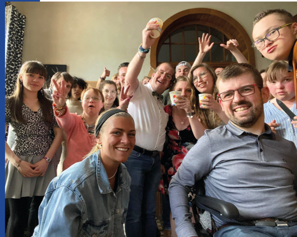
Les colocataires de la maison de Joséphine, habitat partagé pour jeunes adultes handicapés.